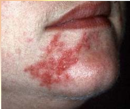
Abuso en el uso de corticoesteroides

Es necesario aclarar, que estos efectos secundarios no son inmediatos, sino son como consecuencia de un ABUSO de los esteroides, debido a que la gente los utilice sin que el médico los haya recetado o que los sigan utilizando aún después de que el médico haya indicado que dejaran de utilizarlos