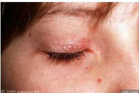
Psoriasis en párpados

Existen otras variantes de la psoriasis como la psoriasis artrítica que afecta las articulaciones y se presenta en el 5% de las personas que padecen psoriasis. Inclusive puede aparecer, sin lesiones en la piel. Por eso es muy importante un diagnóstico oportuno, un conocimiento amplio sobre la